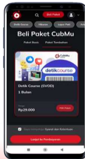
Klik Paket Tambahan Ceklist Saya Menyetujui Syarat dan Ketentuan Klik Lanjut Pembayaran