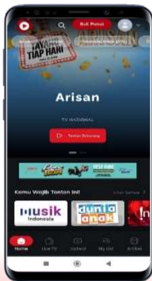
Login pada Platform CubMu Klik Beli Paket