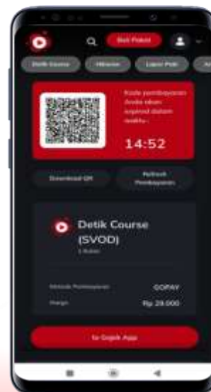
Scan QR untuk pembayaran via QR/Klik to Gojek App

Demikian yang dapat disampaikan. Mohon sekiranya hal tersebut dapat segera dikomunikasikan kepada seluruh divisi terkait. Atas perhatian dan kerjasamanya, Kami ucapkan terima kasih.